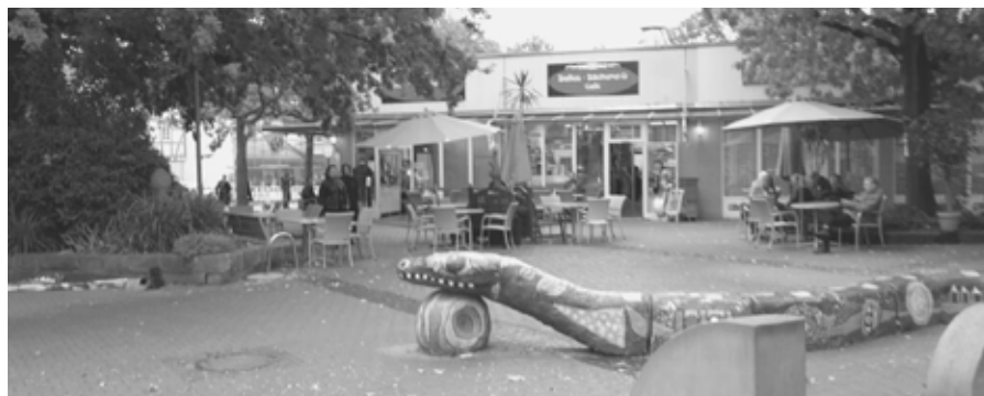
Der Dalles ist das Herz von Mörfelden und prägt das Stadtbild. Der gesamte Platz ist ein beliebter Treffpunkt. Dieser Charakter sollte unbedingt erhalten bleiben.