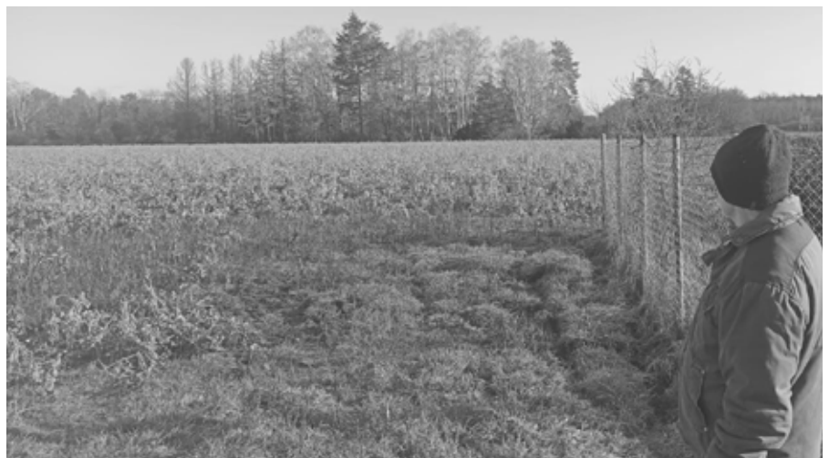
Nach dem Willen der Grün-Schwarzen Koalition soll sich hier bald Aldi ausbreiten. Aufforstung wäre vernünftiger, angesichts der immensen Schäden, die unser Wald erlitten hat.

Wie dem auch immer sei - wir sagen: Aufforstung statt Flächenversiegelung.