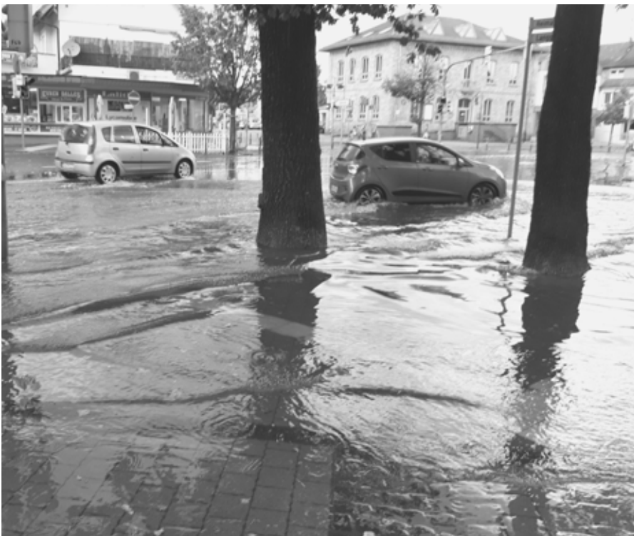
Der Dalles unter Wasser - in Zukunft ein häufiger Anblick? Hier besteht Handlungsbedarf.

Rheinland-Pfalz und anderen Bundesländern. Es gab dennoch erhebliche Sachschäden wie abgedeckte Dächer, vollgelaufene Keller, zerstörte Heizungsanlagen, Elektrogeräte und Hausrat. Gerade der Stadtteil Mörfelden war immer wieder von Hochwasser nach Starkregen betroffen. Verantwortlich dafür ist sicher vorrangig die Zunahme versiegelter Flächen im Stadtgebiet und unzureichende Aufnahmefähigkeit des Kanalsystems. Aber auch die nahegelegenen Bäche wie Gerätsbach, Hegbach, Wurzelbach, Apfelbach und die mit Wasser gefüllten Gräben (See-graben, Kirchnerseckgraben) können in kurzer Zeit überlaufen und große Flächen überschwemmen. Vor allem die südlichen Stadtteile von Mörfelden waren davon immer wieder betroffen. Auch der Gundbach in Walldorf hat schon für Hochwasser und Überschwemmungen gesorgt. Das Wasser hatte am Ortseingang nahe der Feuerwehr gestanden und das ehemalige Klärwerk überflutet. Wir haben dazu eine umfassende Anfrage gestellt.