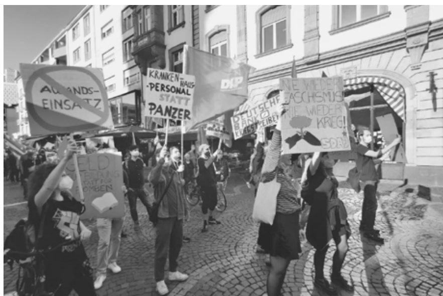
Zahlreiche Aktivist*innen der SDAJ forderten das Ende militärischer Auslandseinsätze und den Stopp von Rüstungsexporten.

Umweltschutz geht nur sozial. Die Kosten müssen von denen gezahlt werden, die uns und unseren Planeten ausbeuten!