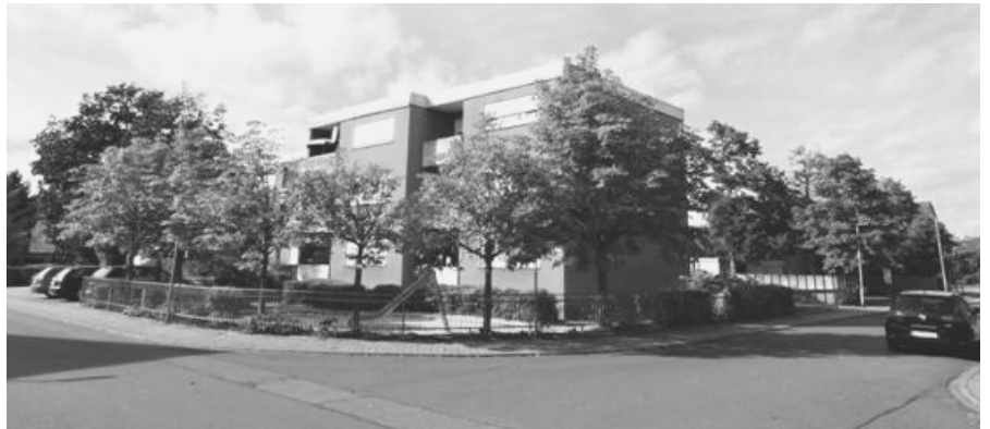
Das Grundstück Parkstraße 35-41 soll an den Eigentümer der daraufstehenden Wohnhäuser verkauft werden. Vernünftig wäre, dass es die Stadt behält und die Gebäude übernimmt.

Die von den Parteien der Grün-Schwarzen Koalition vor der Wahl angekündigte Transparenz und Bürgernähe stellen wir uns anders vor.